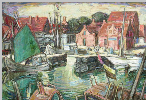
Hafen von Svaneke, Bornholm, 2005, Öl auf Leinwand, 62 x 92 cm