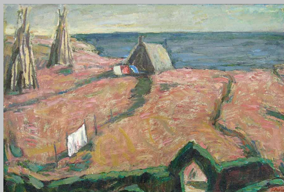
Herbst am Bodden, Ahrenshoop, 2005, Öl auf Leinwand, 41 x 60 cm