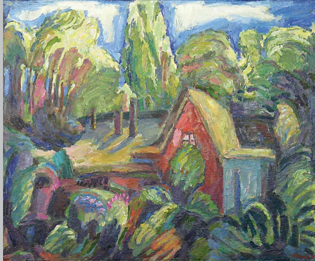
Fischergarten Ahrenschoop, 2005, Öl auf Leinwand, 54 x 67 cm