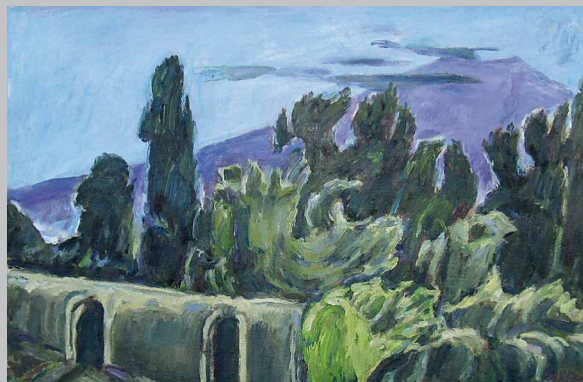
Garten vom Hotel Naxos, Sizilien, 2009, Öl auf Leinwand, 41 x 60 cm